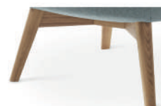
472 Holzgestell Eiche geölt (gegen Aufpreis)